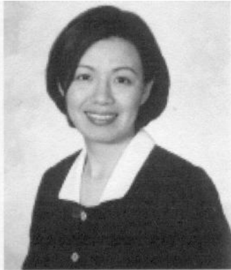
美国密执安大学牙医博士